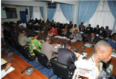
Une scène du deuxième briefing parlementaire de la république démocratique du Congo, conjointement sponsorisé par l'OMS et Sabin Vaccine Institute (SIF)

Le 16 juin 2010, le Sabin Vaccine Institute et l'Organisation mondiale de la santé (OMS) ont été les co-sponsors de la deuxième réunion des membres du parlement de la RDC sur le financement durable de la santé et de la vaccination à Kinshasa. Organisée