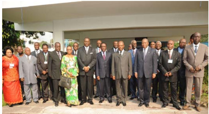
Les participants au second briefing parlementaire sponsorisé par Sabin ont inclus : l'Honorable Évariste Boshab, Président de l'Assemblée Nationale (quatrième à partir de la droite, première rangée), le ministre de la santé, à sa gauche, et le ministre des affaires parlementaires (sixième à partir de la droite, première rangée)

L'événement a attiré l'intérêt des médias, résultant dans une couverture de télévision et de radio nationale. Il est anticipé que le fonds national de vaccination proposé pour la RDC sera présenté à l'assemblée plus tard cette année.