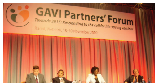
Membres du panel du Forum des partenaires GAVI à Hanoï, Viêt Nam, où les participants ont discuté des opportunités et des défis associés aux vaccinations et des politiques de GAVI.