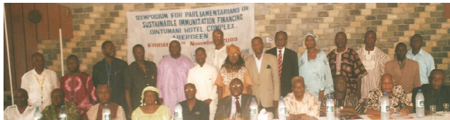
Participants à la réunion après la cérémonie d'ouverture du « Symposium des parlementaires sur le financement durable de la vaccination » organisé à Aberdeen, Sierra Leone.

La Sierra Leone est en train de faire la transition entre la planification d'urgence et celle à long terme après un conflit d'une dizaine d'années au cours duquel le PEV de la nation avait été entièrement supporté par les donateurs. La nation a enregistré une augmentation importante de sa couverture vaccinale, qui est passée de 34 % à la fin du conflit en 2002 à 68 % en 2008 .