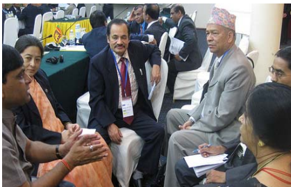
Brainstorming lors d'une session parallèle sur les stratégies SIF pour les pays SIF asiatiques du Cambodge, du Népal et du Sri Lanka au « Troisième Symposium sous-régional pour les parlementaires sur le financement durable de la vaccination » à Phnom Penh Octobre, 2010