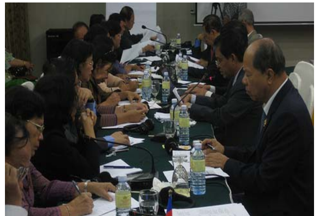
Les délégués du Cambodge au « Troisième symposium sous-régional pour les parlementaires sur la vaccination durable » examinent leur plan d'action SIF. Phnom Penh, Cambodge, 21-22 octobre 2010

Mme Babina Moktan Tamang , membre de l'Assemblée nationale népalaise, a décrit les différentes activités de la Commission de la santé et des affaires féminines et sociales de l'Assemblée nationale pour soutenir les OMD et pour le financement de la santé dans son pays. Sa Commission a soutenu les interventions efficaces pour la santé de la mère et a demandé au gouvernement d'étudier la faisabilité d'un fonds national d'affectation spéciale pour la vaccination. Les parlementaires travaillent sur une loi de soutien (la loi nationale pour la vaccination) qui touchera tous les aspects de la vaccination au Népal. Les membres du Parlement sont aussi conscients du fait que le Népal est en bonne voie pour atteindre les OMD de santé n°4 et 5, et ils en sont fiers.