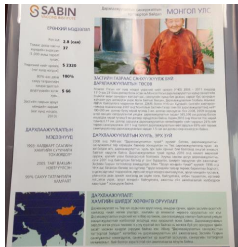
На фото выше: Пример финансового отчета субнациональной программы вакцинации Монголии.