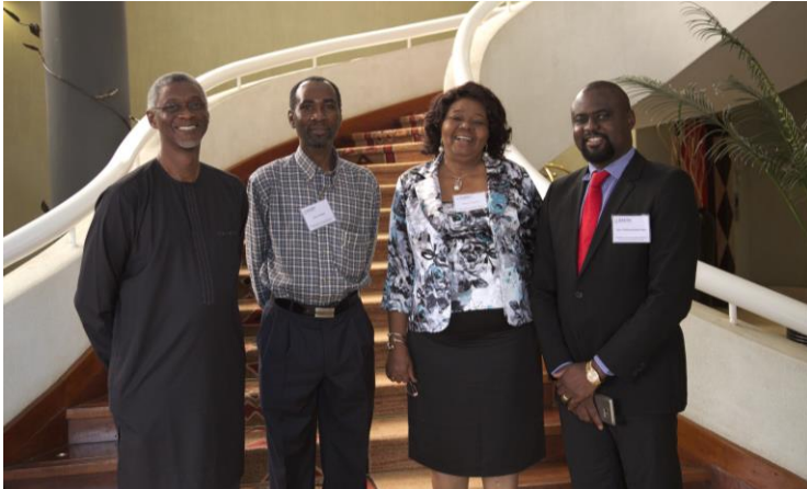
На фото выше: Нигерийские делегаты на коллегиальном семинаре SIF англоязычных стран Африки, 26-28 октября в Найроби, Кения