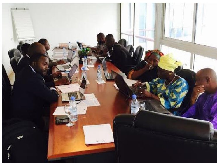
На фото выше: делегаты EPI сводят данные, готовясь к презентации о тенденциях государственного финансирования

Девять участников национальной программы вакцинации из Сенегала, Мали и Камеруна встретились на семинаре по обмену опытом с целью формирования механизмов отслеживания ресурсов для вакцинации , организованном Институтом вакцины Сэбина в сенегальском городе Дакар 19–20 июня . Целью семинара было проведение перекрестного анализа методов контроля исполнения бюджета и разработка общего подхода к контролю расходов на вакцинацию.